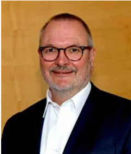
Oberbürgermeister Ralf Claus

die Stadt Ingelheim plant, bis 2025 drei für die künftige Entwicklung unserer Stadt grundlegende Planungsprozesse umzusetzen: die Fortschreibung unseres Leitbildes, die Erarbeitung eines Stadtentwicklungskonzeptes (STEK) und die Neuauflistung des Flächennutzungsplanes (FNP). Mit der Fortschreibung des Leitbildes wollen wir die Ziele für ein zukunftsfähiges und nachhaltiges Ingelheim bis 2035 definieren. Das STEK und der Flächennutzungsplan werden auf dem Leitbild aufbauend die weiteren Prozesse und Instrumente zur Erreichung der definierten Ziele beschreiben und den planungsrechtlichen Rahmen bilden.