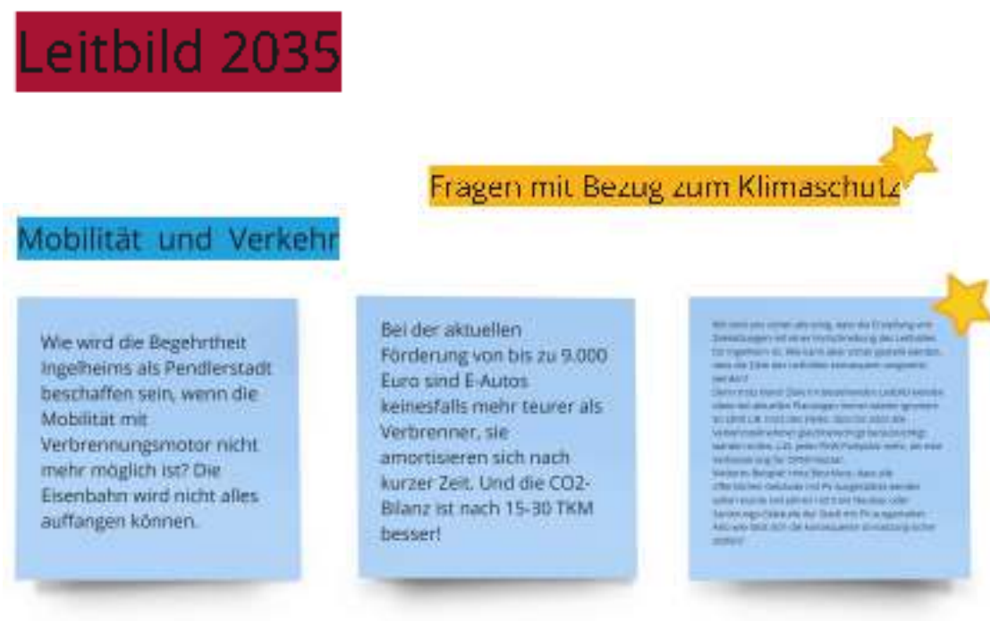
Abbildung 4: Fragen aus der Fish-Bowl-Diskussion zum Thema Mobilität und Verkehr

Die folgenden Abbildungen zeigen die gesammelten Fragen aus dem Chat der Veranstaltung. Sie wurden anhand der bereits bestehenden Themen im Leitbild und neu aufgekommenen Themen gebündelt. Um den Bezug zum Klimaschutz, der übergreifend in den verschiedenen Themenbereichen zu finden ist, deutlich zu machen, sind diese Fragen mit einem Stern gekennzeichnet.