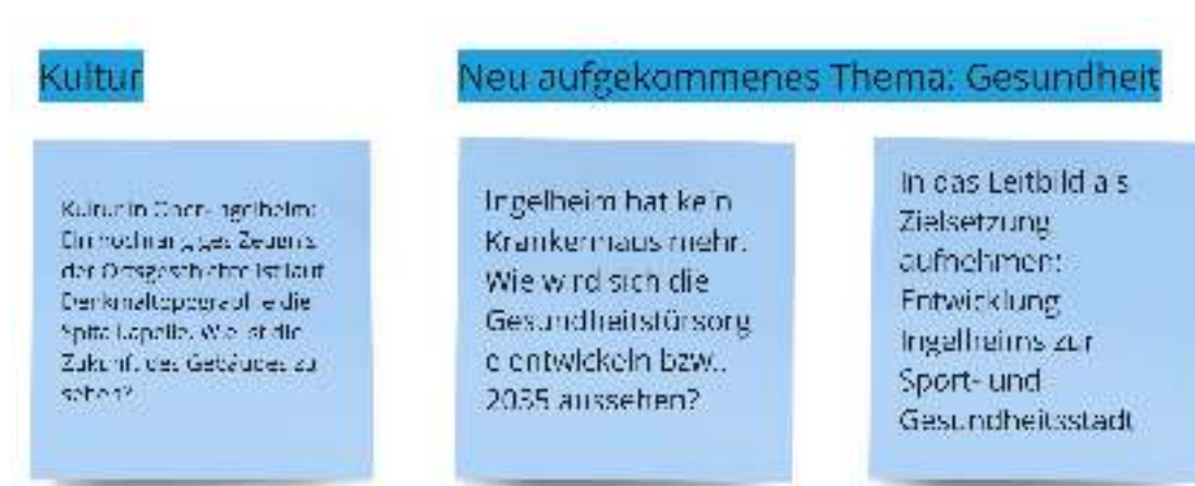
Abbildung 7: Fragen aus der Fish-Bowl-Diskussion zu den Themen Kultur und Gesundheit