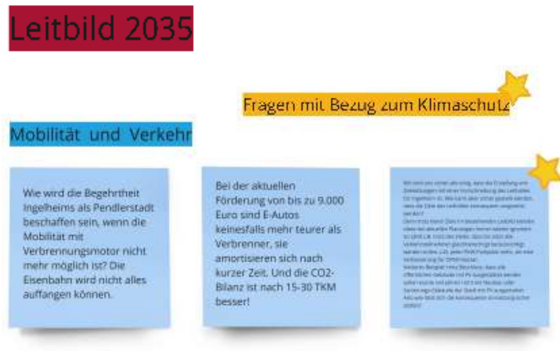
Abbildung 4: Fragen aus der Fish-Bowl-Diskussion zum Thema Mobilität und Verkehr

Die folgenden Abbildungen zeigen die gesammelten Fragen aus dem Chat der Veranstaltung. Sie wurden anhand der bereits bestehenden Themen im Leitbild und neu aufgekommenen Themen gebündelt. Um den Bezug zum Klimaschutz, der übergreifend in den verschiedenen Themenbereichen zu finden ist, deutlich zu machen, sind diese Fragen mit einem Stern gekennzeichnet.